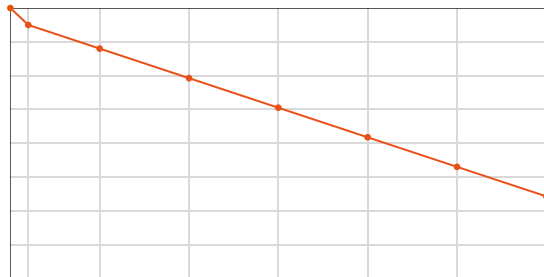
letnia liniowa gwarancja wydajno ci